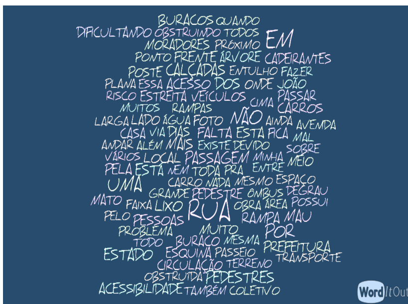
Fig.4 Nuvem de palavras resultante das ocorrências

Os comentários mais recorrentes dos mapeamentos referem-se a calçadas estreitas, esburacadas, irregulares, com degraus e obstruídas (por comerciantes, resíduos, entulhos, carros etc.). Isso, quando há calçadas, pois em muitos locais simplesmente não existe. Notam-se ainda palavras-chave relacionadas à acessibilidade. Pela nuvem de palavras, produzida a partir dos comentários dos participantes da Campanha, é possível visualizar os termos-chave: