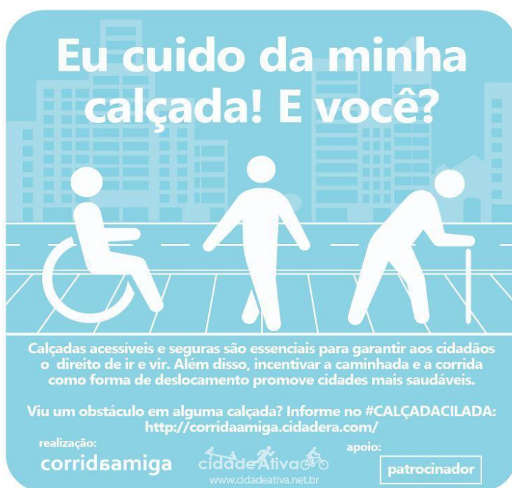
Fig.2 Adesivo “Eu cuido da minha calçada! E você?”

Além disso, foi realizada uma Campanha "positiva" colando os adesivos com os dizeres: "Eu cuido da minha calçada! E você?" nos estabelecimentos que estavam com as calçadas conservadas.