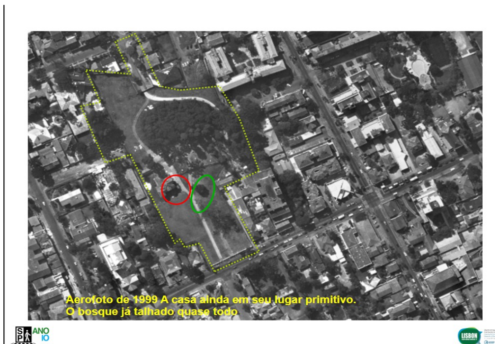
Figura 9: