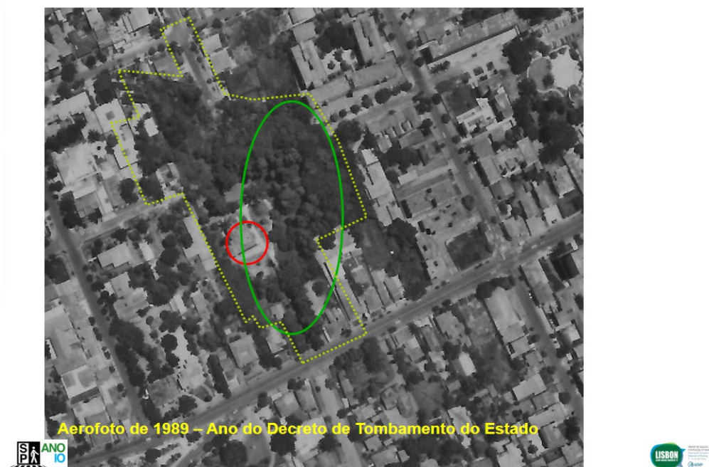
Figura 8:

Em 1989, ocorre o “ tombamento ” 23 da área. A casa, o bosque, o fundo de vale do rio Ivo, começaram a palpitar como limitadores dos interesses do novo proprietário destes 19.430 m 2 situados na Avenida Batel, 1829, adquirido quatro anos antes.