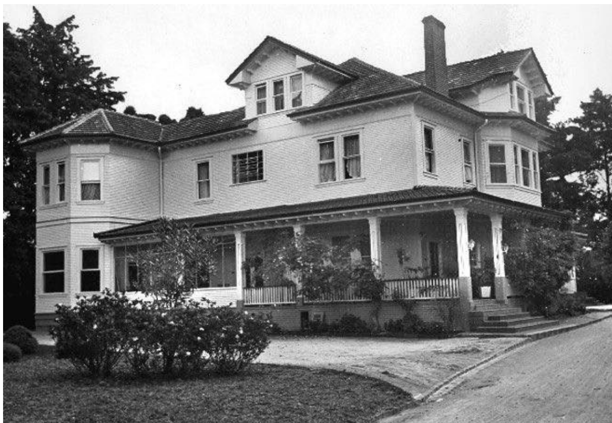
Figura 5: Casa Gomm e seu exótico bosque, na época habitada pelo “embaixador” e família.

A Salvemos o Bosque da Casa Gomm eclodiu e disse não a esta rua de asfalto. Um dos principais argumentos invocados, na época, era que uma rua acabaria por terminar de segregar a casa de sua área envoltória (bosque e jardins), criando um mero simulacro, permanentemente rodeado de carros em movimento - e não de um jardim que lhe desse algum sentido paisagístico, tal como preconizado no decreto de tombamento...” 15