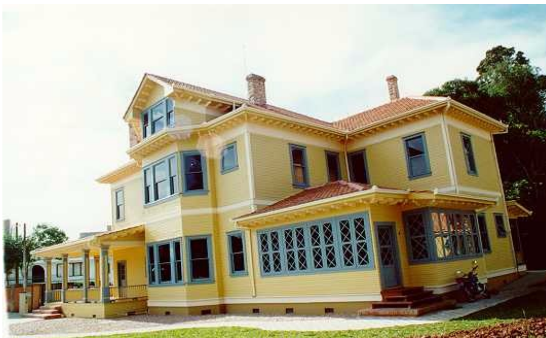
Figura 4: Casa Gomm após restauração e reposicionamento.

Em meio a tudo isso, resulta que um enorme lote, "limpo" dos fardos da edificação histórica e do bosque, estaria assim livre para ser edificado em sua totalidade em proporções titânicas.