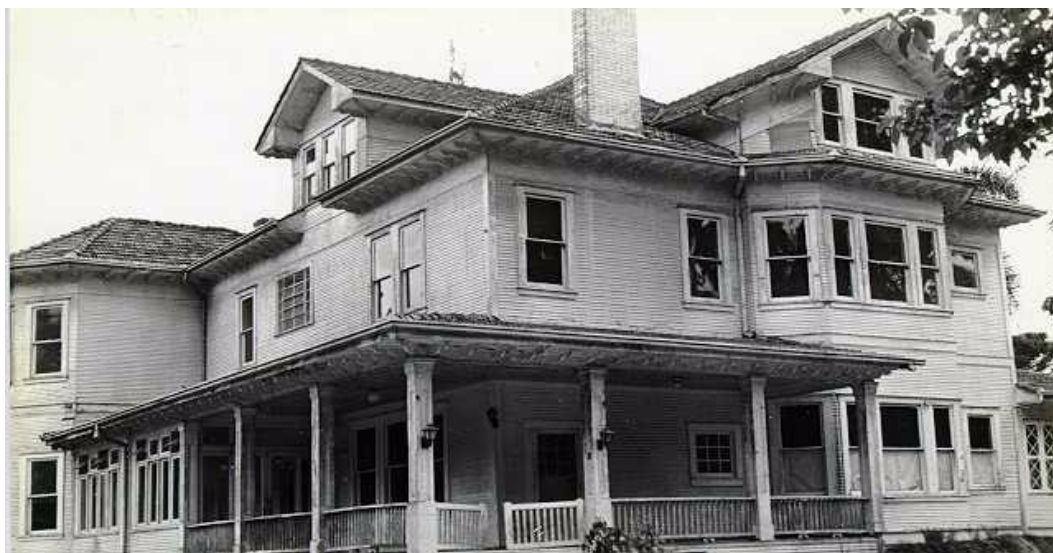
Figura 3: Casa Gomm, na sua posição original, antes da relocação (2003)

O declínio da economia extrativista com o surgimento de processos industriais, pôs fim a muitos interesses econômicos, que não souberam enxergar ou dinamizar seus negócios. Os Gomm, foram uns deles.