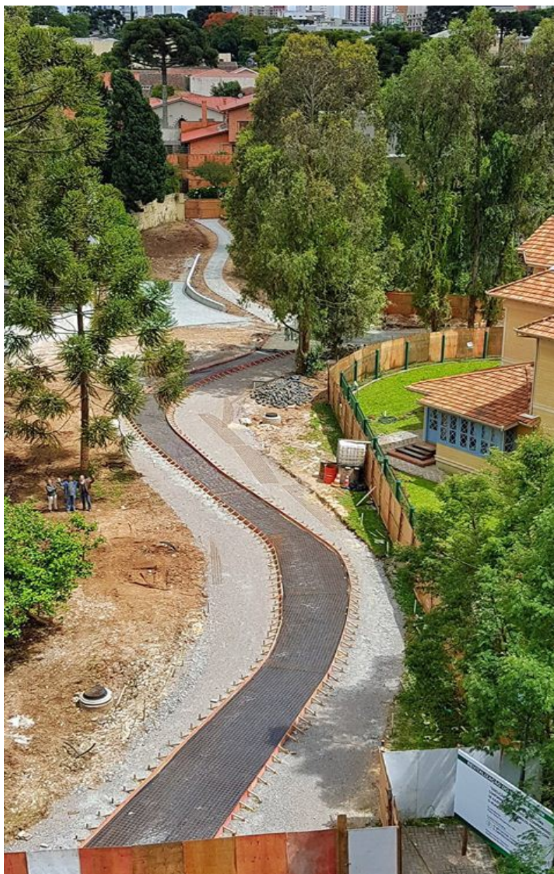
Figura 6: Via de emergência: exigência do corpo de bombeiros para funcionar o empreendimento – ônus que fica suportado por área pública oriunda do parcelamento da matrícula e subsequente doação ao poder público.