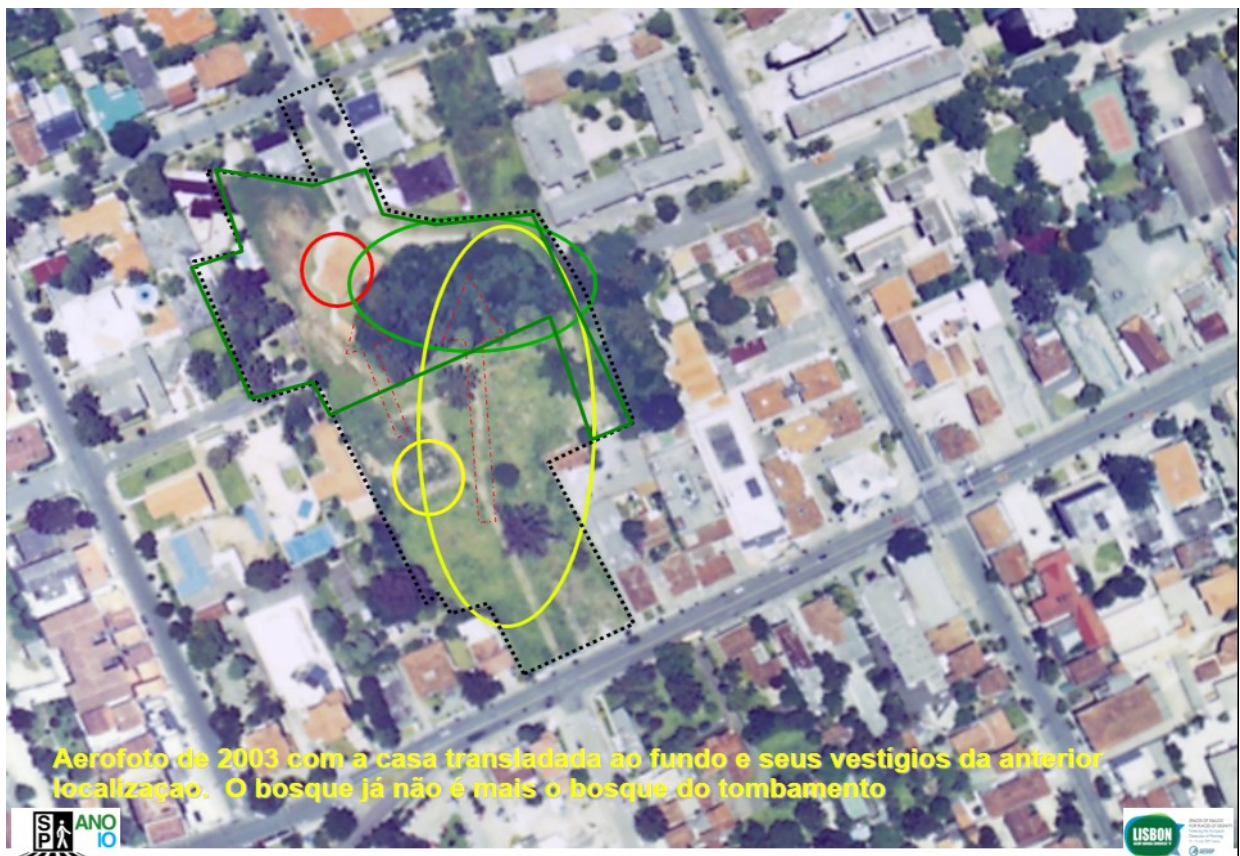
Figura 10: