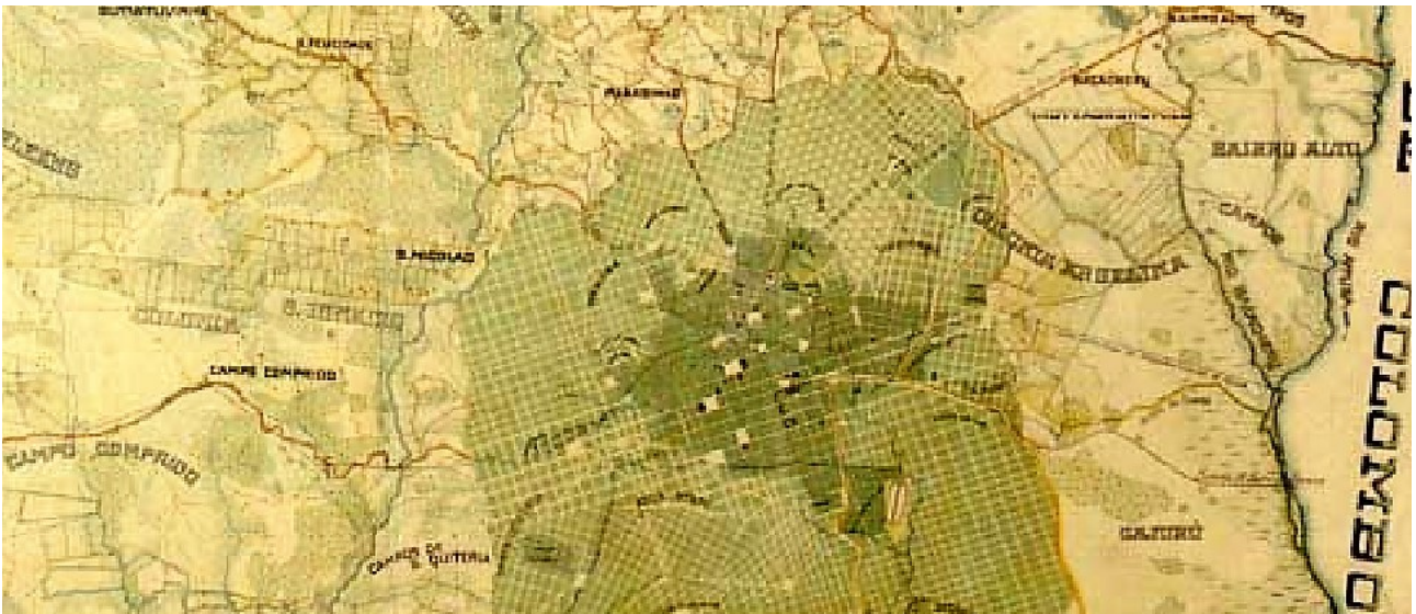
Figura 1: Fragmento central do mapa de Curitiba de 1915 – IPPUC. Notam-se os eixos de ocupação e as zonas verdes da cidade.

Nos anos 1930/1940 – Harry Blas Gomm, filho de Henry e Isabel, se casa com Luísa Bueno, filha de diplomatas. O casal se fixa em Curitiba e vai viver no casarão da Avenida Batel. A mansão se torna ponto de encontro de estrangeiros, intelectuais e industriais. Blas se torna cônsul inglês no Paraná.